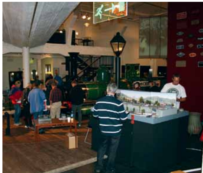
Stort besøk og mange utstillere preget Jernbanemuseets dag.

I forbindelse med Leke- og byggehelgen 11. desem-